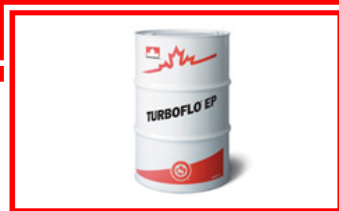
Тест на окисление во вращающейся камере высокого давления (RPVOT) ASTM D2272